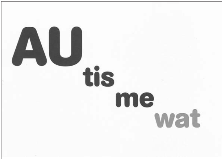
Spreuk van de NVA autismeweek 2010

Een folder over autisme is nooit compleet. Voor meer informatie en/of vragen verwijzen we je naar intranet en de expertisegroep "Autisme" van Koninklijke Visio.